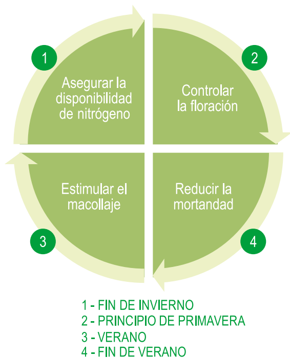
Figura 1 - Cuatro objetivos de manejo para asegurar la persistencia productiva de pasturas de festuca o dactylis, asociados a cuatro épocas del año.

nor área a implantar cada año. La mayor estabilidad se debe, primero, a que esta reducción del área a implantar anualmente aumenta el área disponible para pastoreo entre marzo y junio y segundo, a que las mejores condiciones de piso que ofrecen las pasturas largas permite continuar pastoreando con alta humedad de suelo, situación frecuente entre mayo y agosto. Finalmente, el mayor impacto positivo en calidad de suelo se debe a que las pasturas largas proveen una cobertura continua del suelo reduciendo el riesgo de erosión. Asimismo, aportan raíces continuamente, lo que contribuye a la formación de materia orgánica y mantienen bajos los niveles de nitratos disminuyendo el riesgo de pérdida por lavado. Sin embargo, estos beneficios se expresarán solo si se asegura su persistencia productiva.