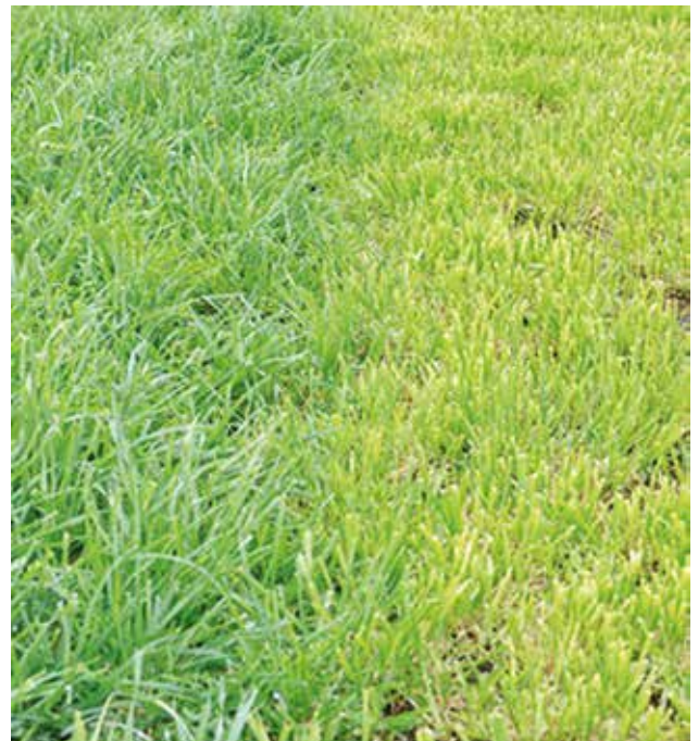
Figura 2 - Ensayo de Dactylis en INIA La Estanzuela.

El segundo objetivo es controlar la floración, es decir, minimizar la presencia de tallos reproductivos, para asegurar que no se acumule material de baja calidad rechazado por el ganado y así mantener pasturas cespitosas con mucha hoja. Para esto hay diferentes alternativas, todas complementarias.