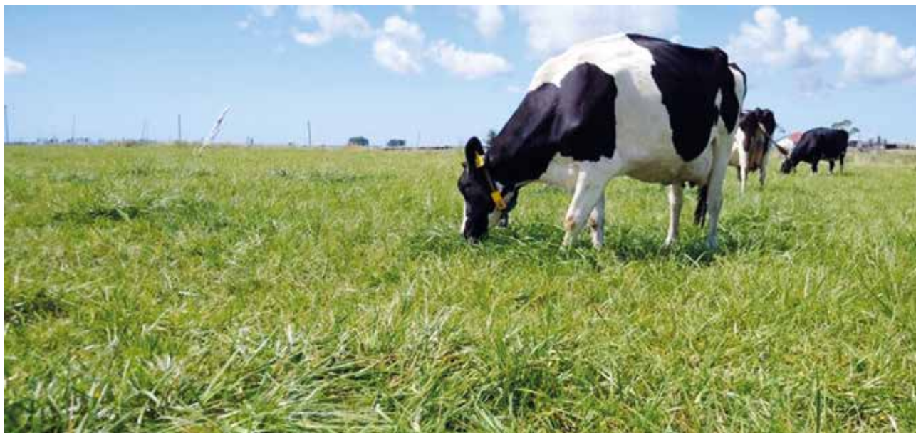
Figura 4 - Creciente uso de festuca en sistemas lecheros.

La persistencia productiva de pasturas basadas en festuca o dactylis requiere (1) asegurar una buena disponibilidad de nitrógeno desde fines de invierno, (2) controlar el desarrollo reproductivo al comienzo de la primavera, (3) cuidar la supervivencia de macollos durante el verano, y (4) estimular la producción de nuevos macollos una vez que termina el verano. La Figura 1 resume estas cuatro etapas y los objetivos a lograr en cada una, y la Figura 3 resume cómo implementar esos objetivos. Aplicados en forma consistente, año a año estos cuatro pasos permitirán obtener pasturas de festuca o dactylis productivas y persistentes.